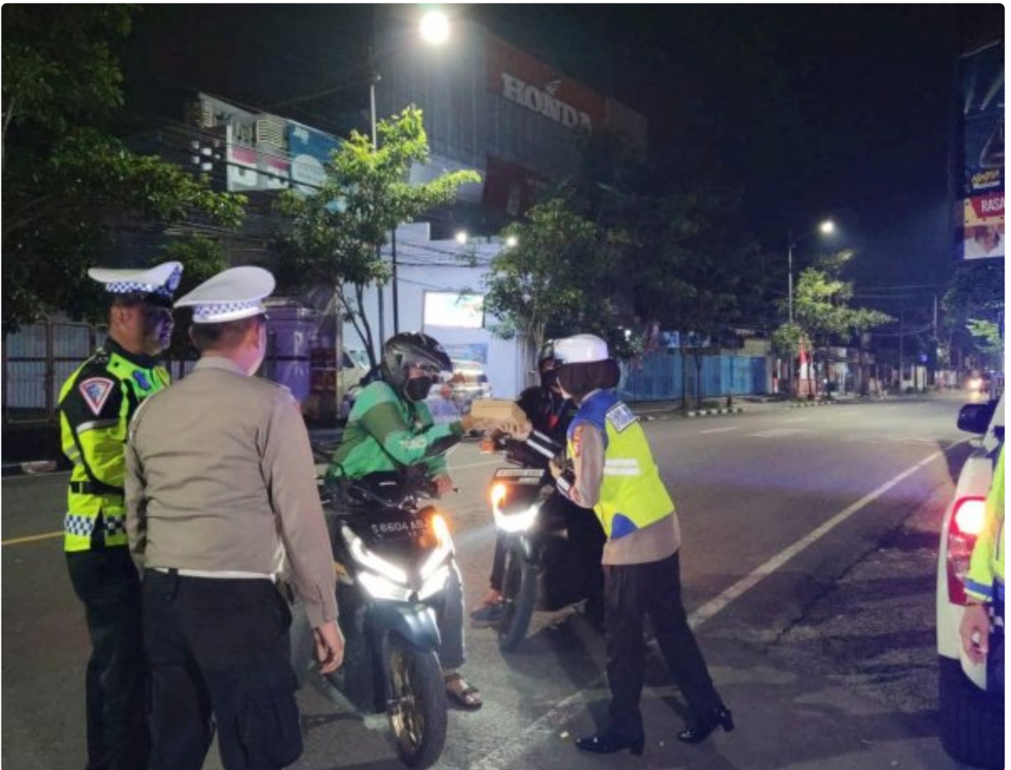
Satlantas Polres Bojonegoro membagikan makanan sahur ke pengguna jalan

BOJONEGORO - Satuan Lalu Lintas (Satlantas) Polres Bojonegoro kembali melaksanakan bakti sosial dengan membagikan makanan sahur kepada warga masyarakat yang membutuhkan, Senin (25/3/2024) dini hari.